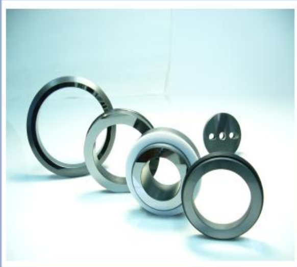
Fabricación de dados para proceso de extrusión.