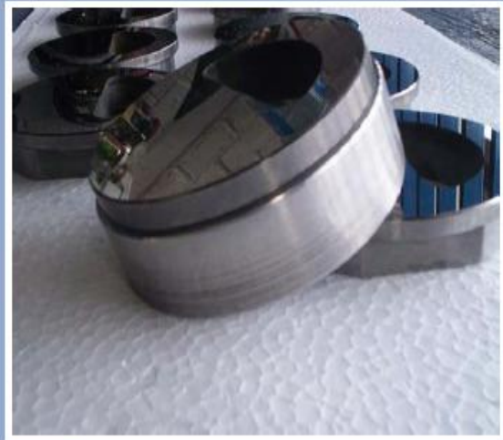
Dados de Carburo de tungsteno para estrangulador