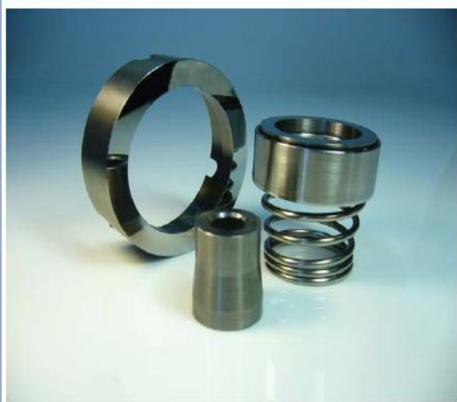
Dados para la Industria de Fabricación de tubos y Sellos Mecánicos.