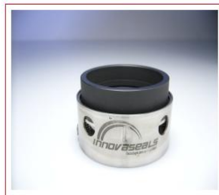
TIPO 18 y 19 Equivalente a JOHN CRANE tipo 8/9